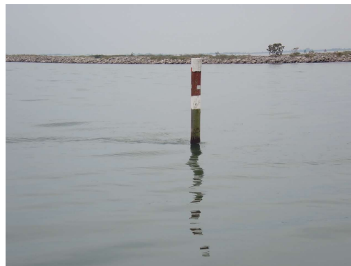
Vetra ni, je pa dva do tri vozle toka, saj je najvišja plima že mimo in se voda vrača v morje.