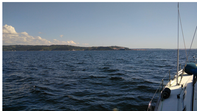
Na slovenski strani je že boljše.