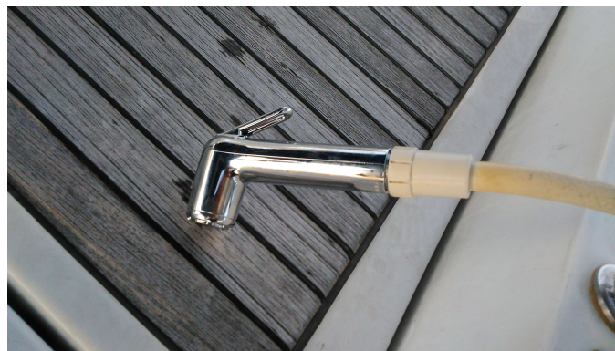
Nova slušalka tuša na krmu. Prejšnja je bila boljša.