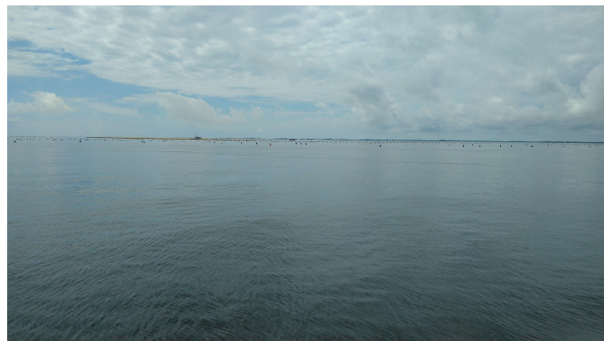
Na izhodi školjčišča.