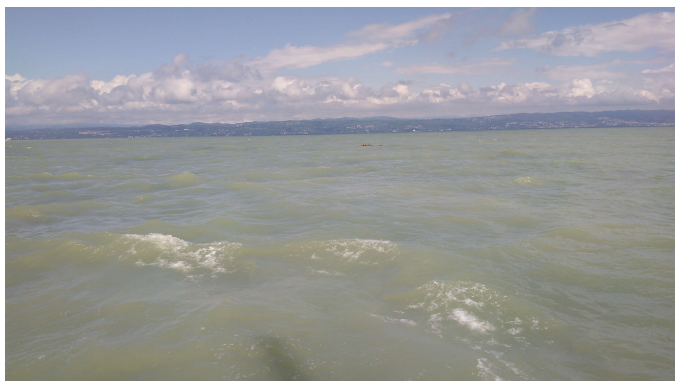
Takole izgleda Tržaški zaliv.