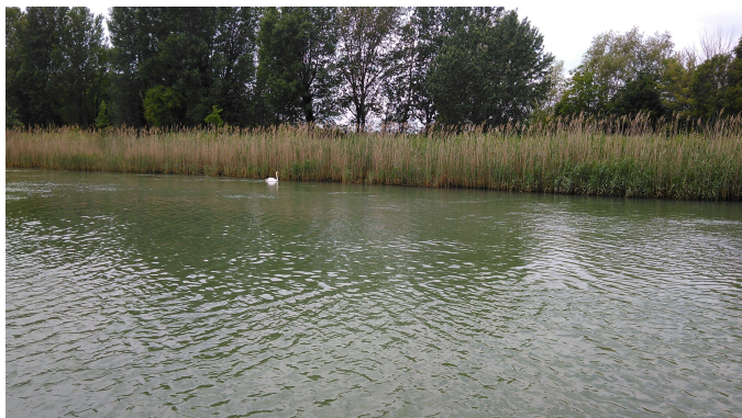
plovba po kanalu. Labodi namesto galebov.