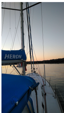
Heron ima končno jadra.

Tule v Funtani je lepo sidrišče, le precej se guncamo, ker s estalno eni motornjaki in jeti vozakajo po zalivu. Upam, da se zvečer umiri.