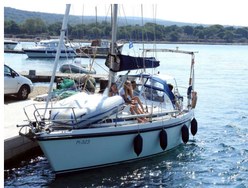
obisk na Lari