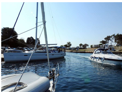
gneča pred Osorskim kanalom

V Jaziju nas sredi turkizne vode čaka Baja4. Poskakovanje po valovih maestrala se v času našega druženja popolnoma umiri. Obe posadki že danes prav sladko zaspita.