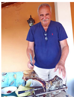
obisk pri Jelovcu, domačinu Vrsarja

Ob 23.30 se priveževa na severno obalo pred mostom. Inkasanta ni na spregled.