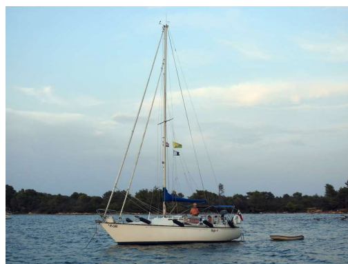
Baja4 v zalivu jazi, Molat