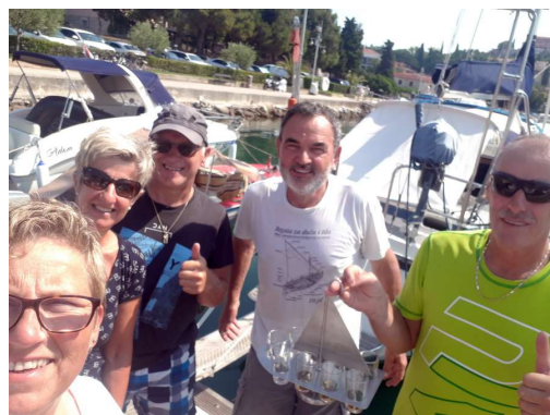
kozarček za srečno pot s sosedi Avstrijci