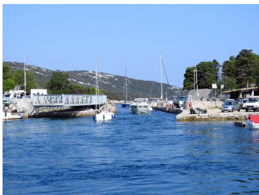
veliko plovil je želelo zamenjati strani morja