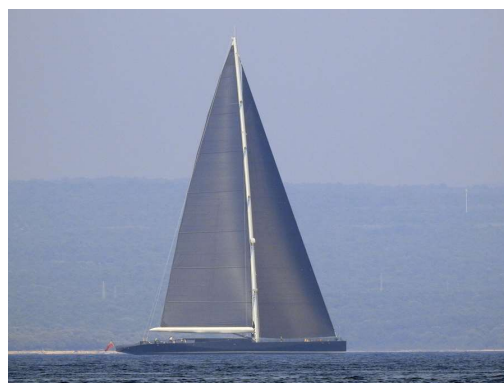
217 čevljev dolžine in 33 čevljev širine...