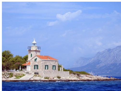
svetilnik na V rtu Hvara