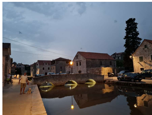
na koncu se vije kot reka