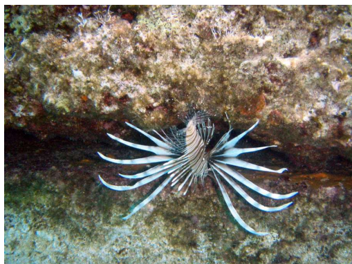
plamenka pod pomolom - Pigadi, Ithaka

Zvečer odveslava na obalo in se sprehodiva okoli celega zaliva na JZ stran. Tam je prijazen mali bife. Meni postrežejo z velikim točenim, Arnu s skodelico vode.