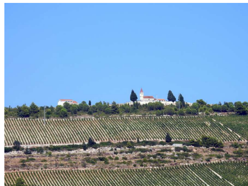
lepi novi vinogradi, bomo prišli pokušat vino čez nekaj let...