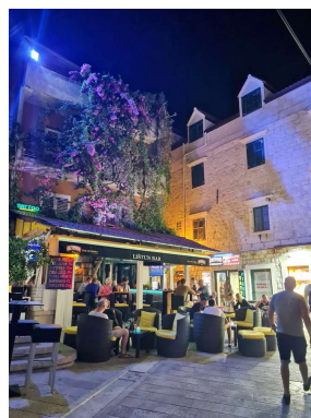
lokali polno zasedeni