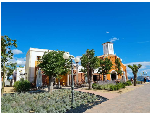
naj bi bil shopping center in bifeji, a še ni vse v funkciji