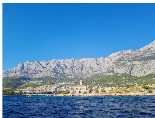
Makarska pod mogočnim Biokovom