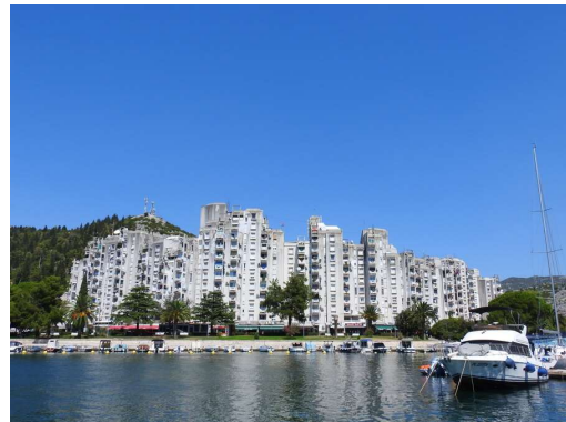
Ploče nekoč in danes...