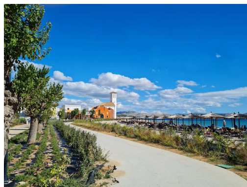
za zelenjavo zelo lepo skrbijo