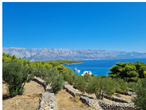
med Rasotico in Sumartinom so lepi zalivi