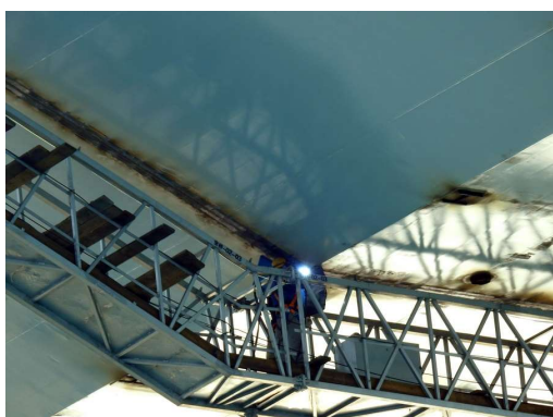
Kitajčki delajo tudi za Velo Gospo