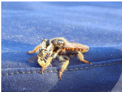
tale nestvor je priletel na Laro prebavit oso - kdo ve, kaj je to?