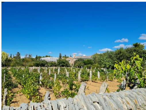
Dalmatinska vas, sklop restavracij v izgledu vasi, je urejena veliko bolj prijetno in domiselno