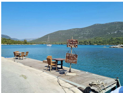
turisti na obzorju