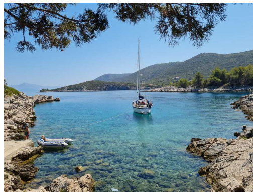
na skalah so betonske bitve