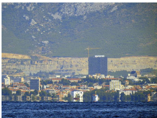
nova "moteča" stolpnica v Splitu, ki je razburila kar nekaj arhitektov