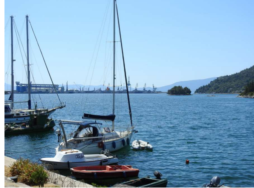
pogled proti JV izdaja lokacijo