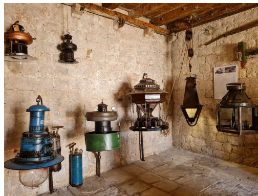
riške svetilke nekoč in danes