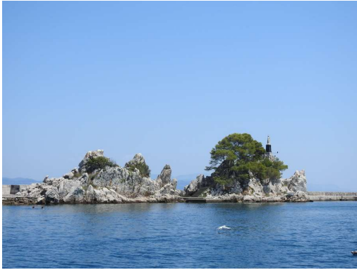
pogled iz pristanišča, na desni so zastonj vezi