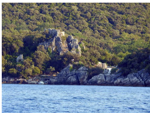
lepa severna obala Pelješca