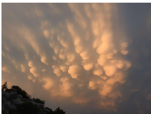
nevihtni oblaki 2