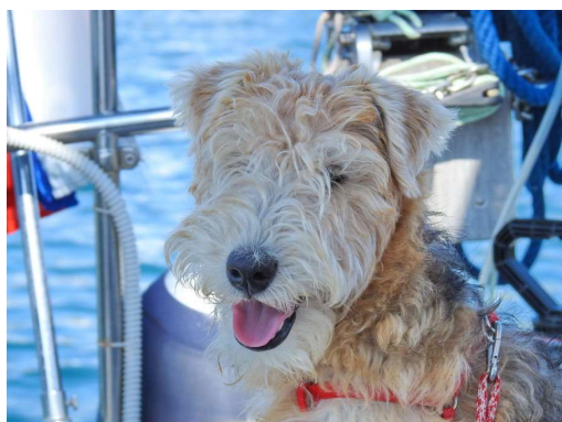
Arno je bil vesel družbe