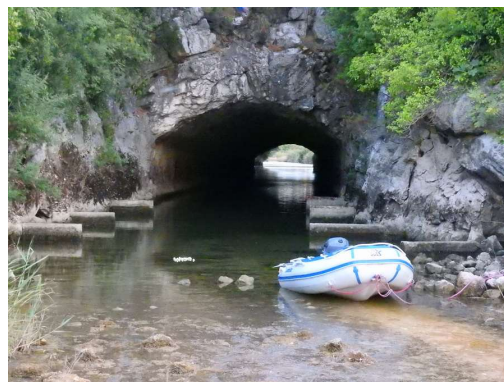
tunel pod Jadransko magistralo do Baćinskih jezer