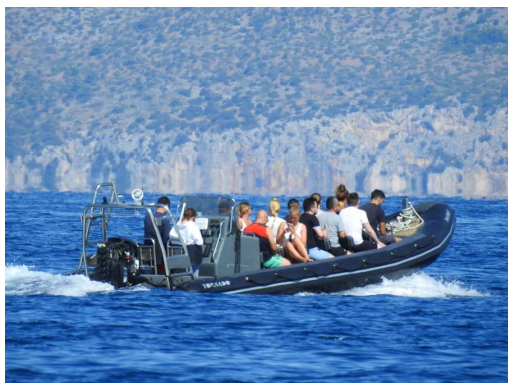
moderni gusarji letijo do Visa