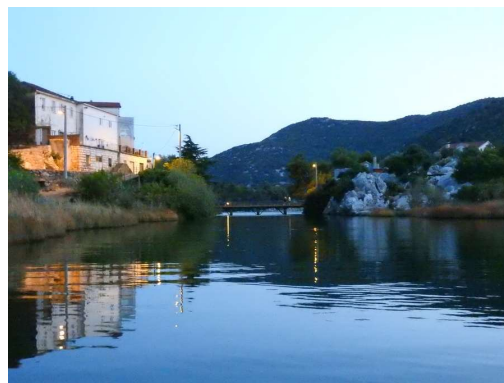
Baćine gledano iz potoka