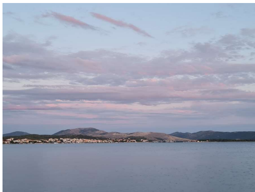
pogled iz priveza v Solarisu na JV