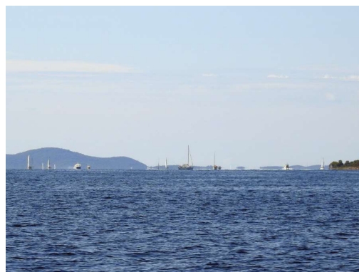
še vedno veliko prometa v Splitskih vratih