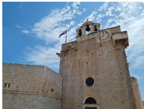
cerkev - trdnjava nad vasjo