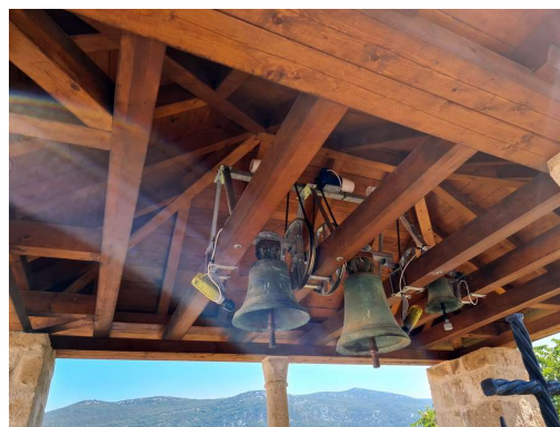
moderni zvonovi starodavne cerkvice v Malem Stonu