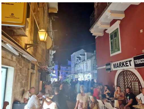
ulice so polne turistov