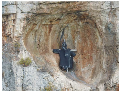
domačin je okrasil pečino s staro potapljaško obleko