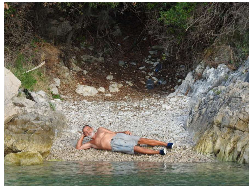
plaža samo za nas