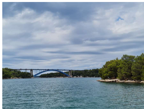
pogled iz skrivališča v Morinjskem kanalu - most če Jadransko magistralo