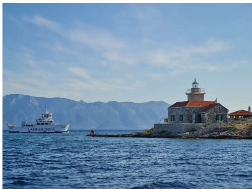
svetilnik pri Sućuraju s kopenske strani