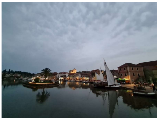
pogled na dolg zaliv Vrboske