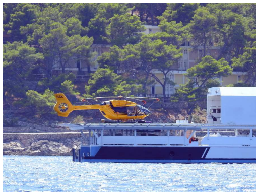
ima celo štalco za helikopter