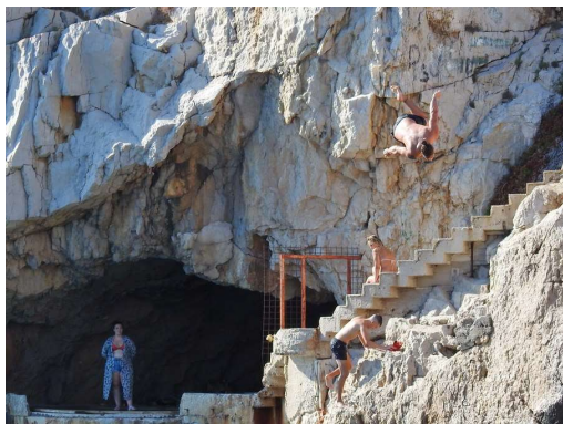
skakalec s pečin pred vhodom v pristanišče