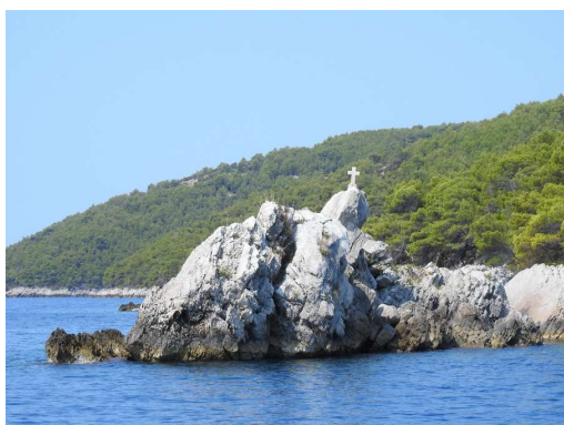
čeri s križem