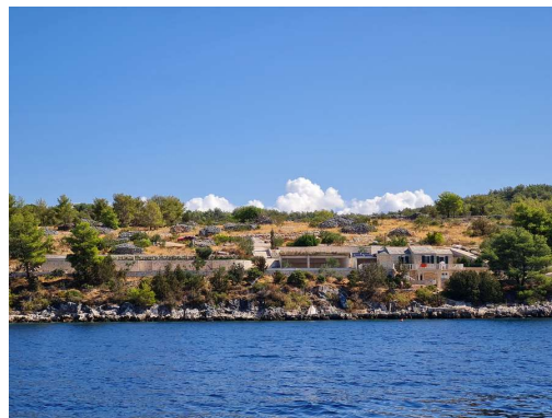
hacienda zahodno od vhoda v zaliv