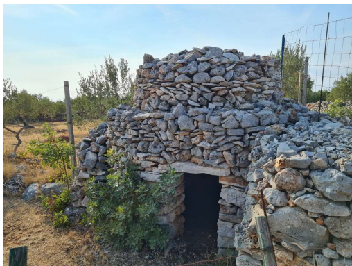
v Istri je to kažun, v Apuliji truli