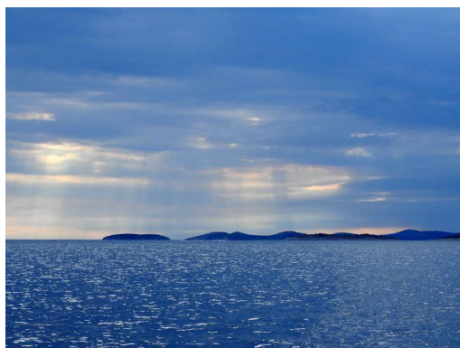
oblaki se zbirajo, barve so vedno bolj jesenska

Skrijeva se v Morinje, ker obetajo močne severne vetrove in vesoljni potop.