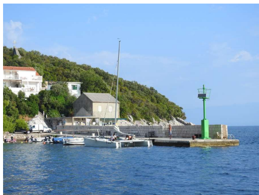
pomol v Cerkvicah

Valovom smo ubežali, sunkom vetra izgleda, da ne. Kapitan za vsak slučaj raje spi v kokpitu.