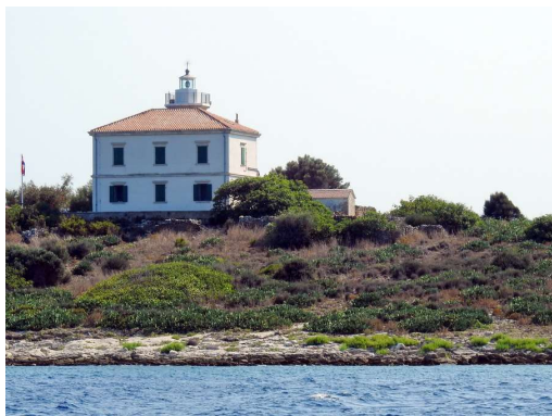
svetilnik na Pločici