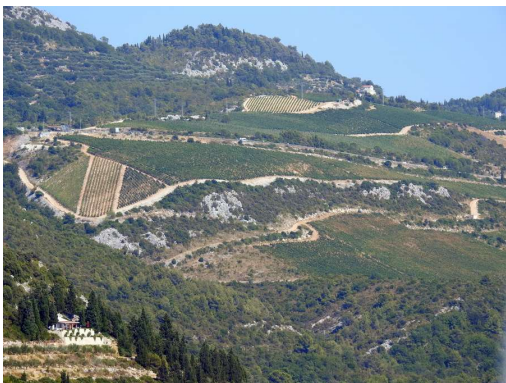
gorice pred novim mostom