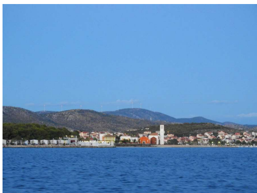
pogled na Solaris z morja