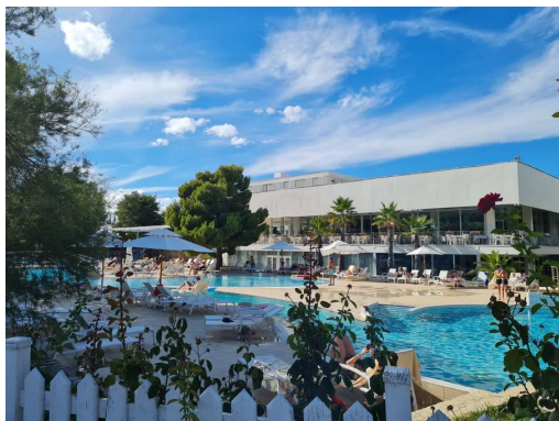
za tiste, ki ne marajo peščenih plaž...