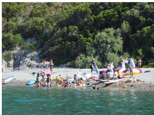
včerajšnji party na Jezerih

Morda je malo bolj sveže kot včeraj in nas je zato popadla spalna bolezen.