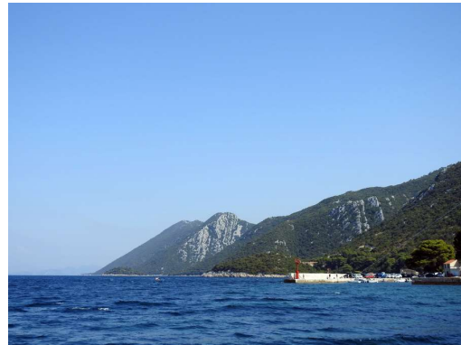
Pelješac pogled nazaj proti vhodu