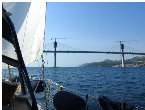
novi most z druge strani