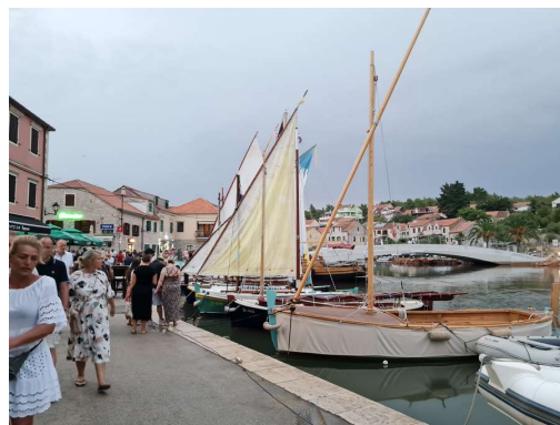
stare jadrnice z različnimi vrstami jader