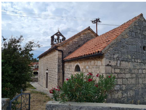
vaška cerkev, Jadrtovac