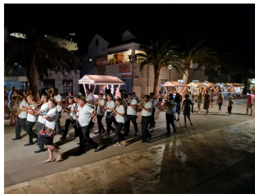
pihalna godba v elementu