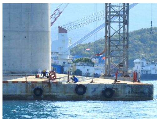
marljivi Kitajci na sobotno popoldne