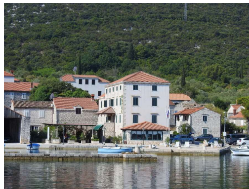
skoraj prazni hoteli