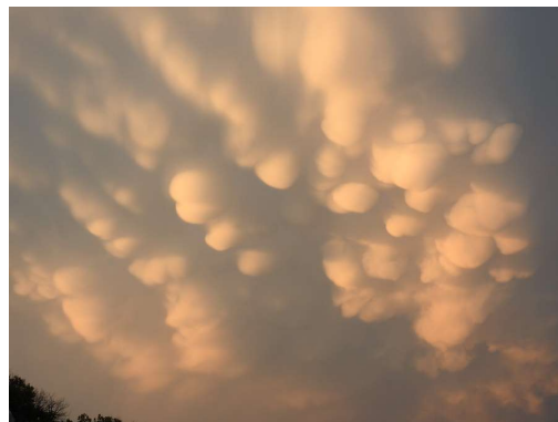
nevihtni oblaki 1