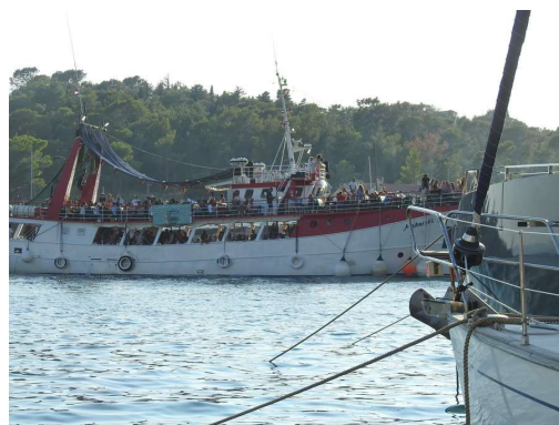
(pre)veliko število potnikov nikogar ne vznemirja