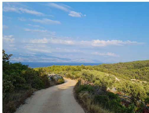
severna obala Brača