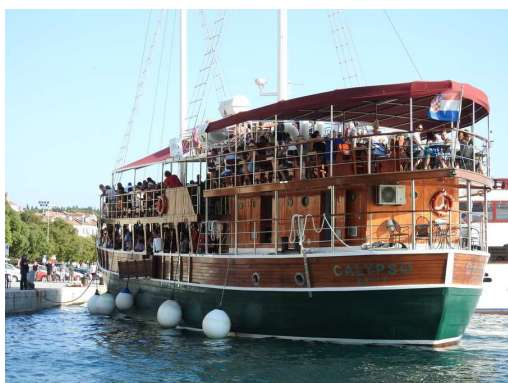
gusarji v Makarski - a la sardina ship