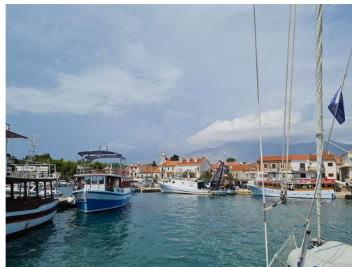
Sućuraj pred preходом fronte