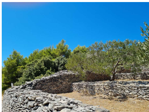
obnovljeni oljčni nasad