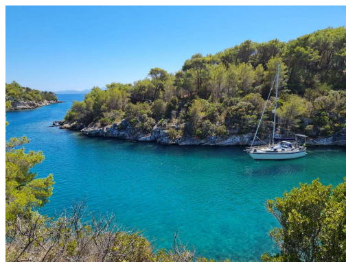
Rasotica in Lara