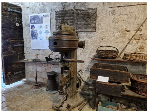
priprave za konzerviranje sardel