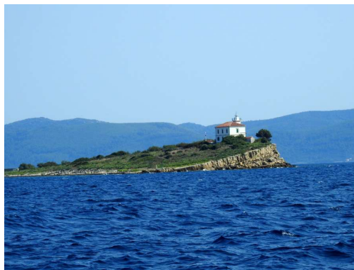
Pločica iz SZ