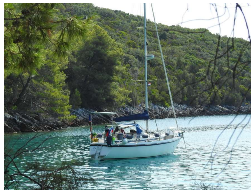
Lara v Aržišču