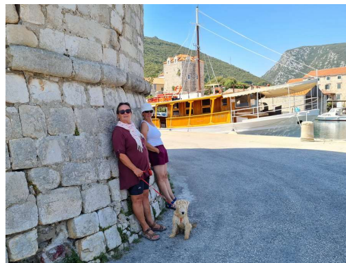
brez sence nam živeti ni