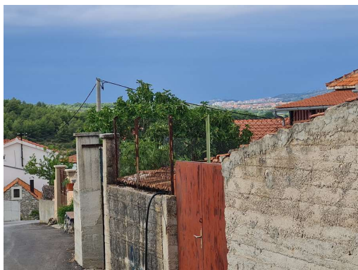
nad Šibenikom so črni oblaki, burja se prebuja