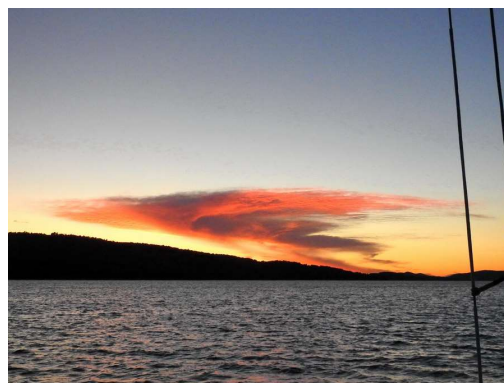
po sončnem zahodu za Zlarinom