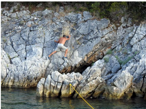
mojster nas privezuje