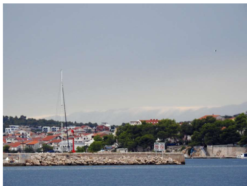
Krapanj in za njim Velebit z belim pokrivalom