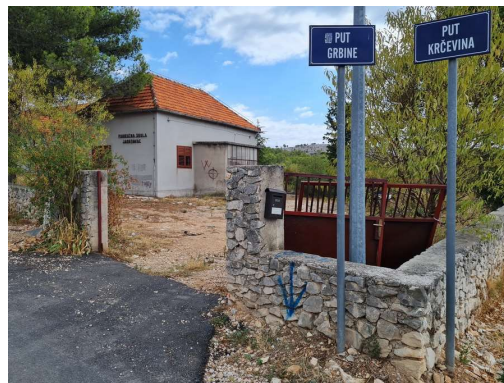
včasih osnovna šola, danes vinarska zadruga