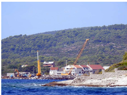
gradbišče novega trajektnega pristanišča v Sućuraju

Tudi tu je zgornjih nekaj centimetrov vode ledene, spodaj so toplice. Voda in zrak sta danes umirjena. Uživamo v kohanju, branju in štetju zvezd. Za spremljavo nam pojejo črički.