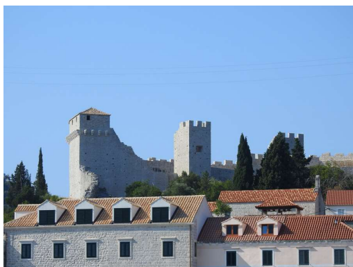
obnovljeno Stonsko obzidje