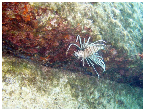
plamenka pod pomolom - Pigadi, Ithaka