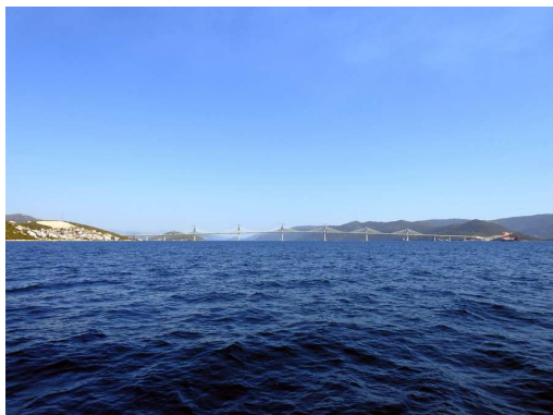
novi Pelješki most