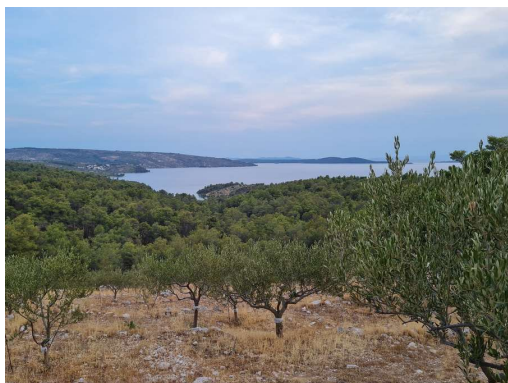
pogled na Stipansko