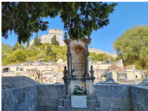
zaključek ambiciozno zastavljenega sprehoda