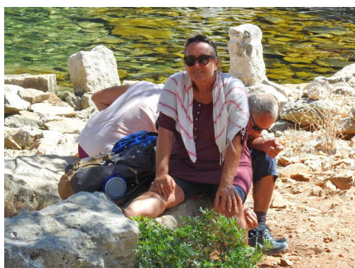
utrujena vojska se je vrnila