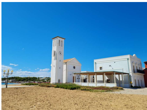
najnovejša gradbena mojstrovina na samem rtu

Pozno zvečer se veter umiri in odropotava na sidro v Zlarin. Naveličala sva se mimohoda turistov.