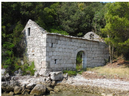
včasih je bila lepa hiša