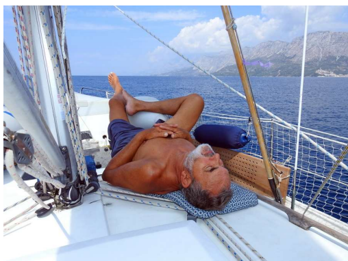
kapitan ima siesto