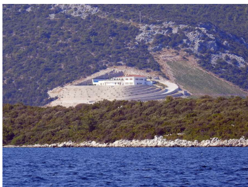
bodoča vinska klet iz EU sredstev