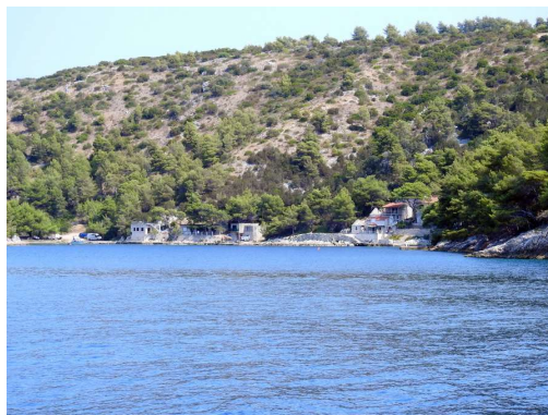
drugi zalivi so pozidani