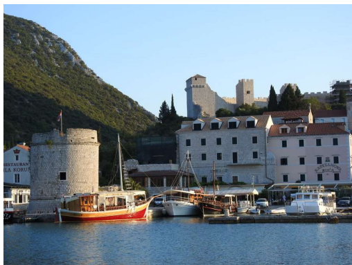
turistične barkače samevajo

Sestavine likerja iz raja nismo uspeli določiti.