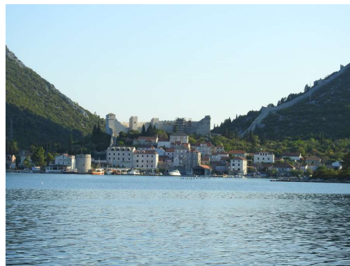
Mali Ston iz terase restavracije Lara