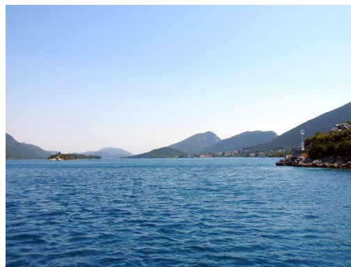
Malo Stonski zaliv