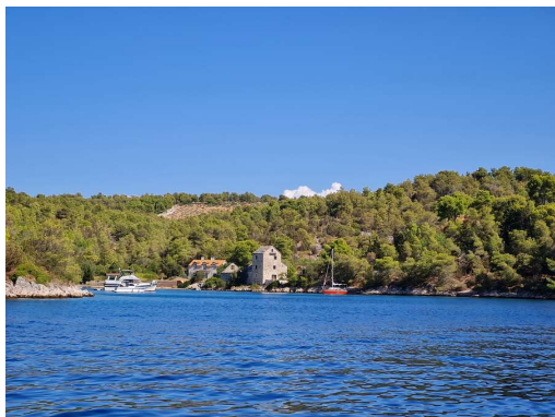
Stipanska na Braču