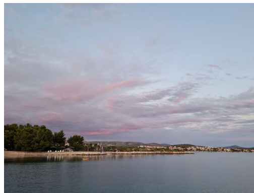
pogled iz priveza v Solarisu na V