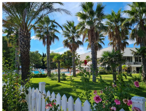
bazeni v zelenem okolju