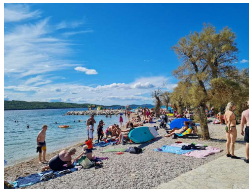
prepolna plaža pred kampom