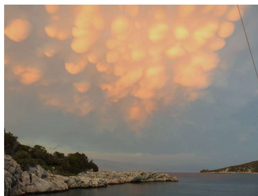
nevihtni oblaki 3 in so šli...