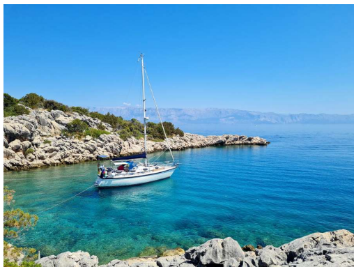
stranski zaliv Pokrivenika